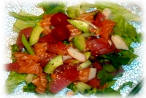
Salade verte, thon, saumon, avocat, tomate & concombre