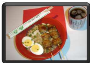
NARUTO POULET 8 €