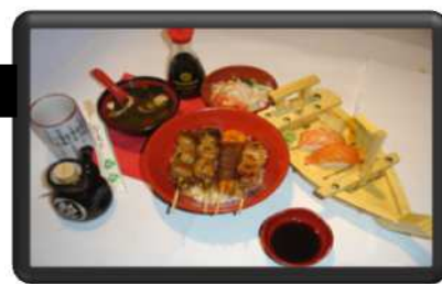
SAKURA SUSHI 9 €