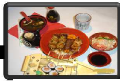
SAKURA MAKI 9 €