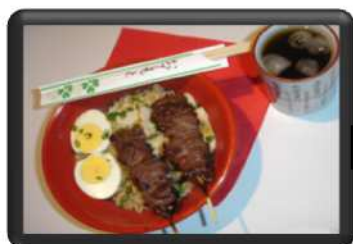
NARUTO BŒUF 8 €

Boisson au choix : Coca ou orangina ou Ice tea ou jus d'orange